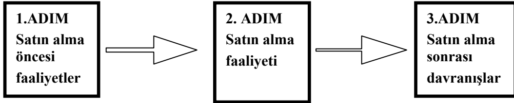
Şekil 2: Tüketici Davranışı Satın Alma Süreci

görüldüğü gibi genellemelere gidilmektedir (Rızaoğlu, 2003: 42). Bu genellemeye göre satın alma öncesi faaliyetler olarak düşünme, bilgi toplama, plan yapma, karar verme sayılabilir. Bu karar neticesinde satın alma faaliyeti gerçekleştirilir ve satın alma sonrasındaki davranışlar kapsamında da memnuniyet ya da memnuniyetsizlik ortaya çıkar.