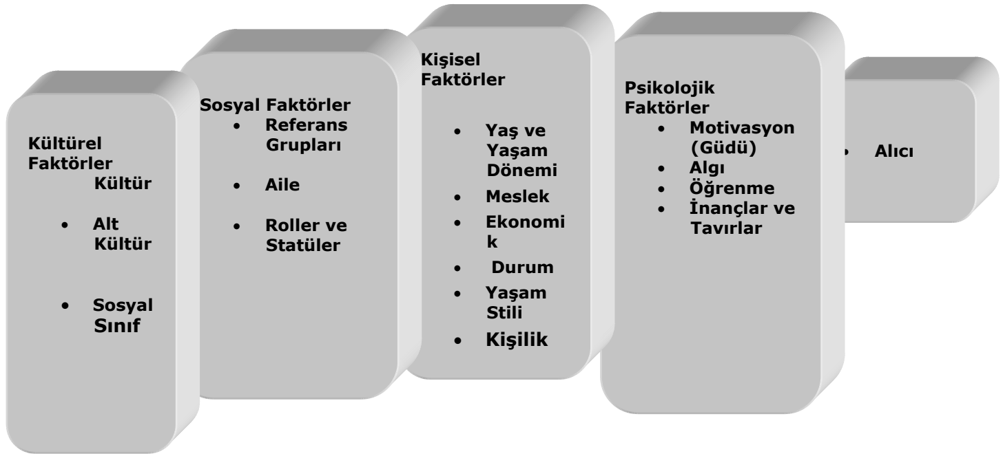
Şekil 3: Tüketicilerin Satın Almasını Etkileyen Faktörler

Kaynak: Philip Kotler and Gary Armstrong, Principle of Marketing Prentice Hall International Edition, 1994, s: 137.