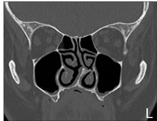
RESİM 1: Sol nazal pasajda daralmaya neden olan septum deviasyonu bulunan ve ek burun patolojisi olmayan bir hastanın paranazal sinüs tomografisi incelemesi.

Hastaların septum deviasyonu tanısı, öykü, nazal endoskopi ve bilgisayarlı tomografi ile konuldu. Anterior rinoskopi, nazal endoskopi ve paranazal sinüs tomografisi ile tespit edilen septum deviasyonu hastaları çalışmaya dâhil edildi (Resim 1). Kontrol grubuna dâhil edilen katılımcıların, rutin kulak-burun-boğaz muayeneleri, nazal endoskopik muayeneleri yapıldı ve herhangi bir patoloji tespit edilmeyenler çalışmaya alındı. Septum deviasyonu hastalarının ve sağlıklı katılımcıların nazal muayene, endoskopi veya görüntüleme-