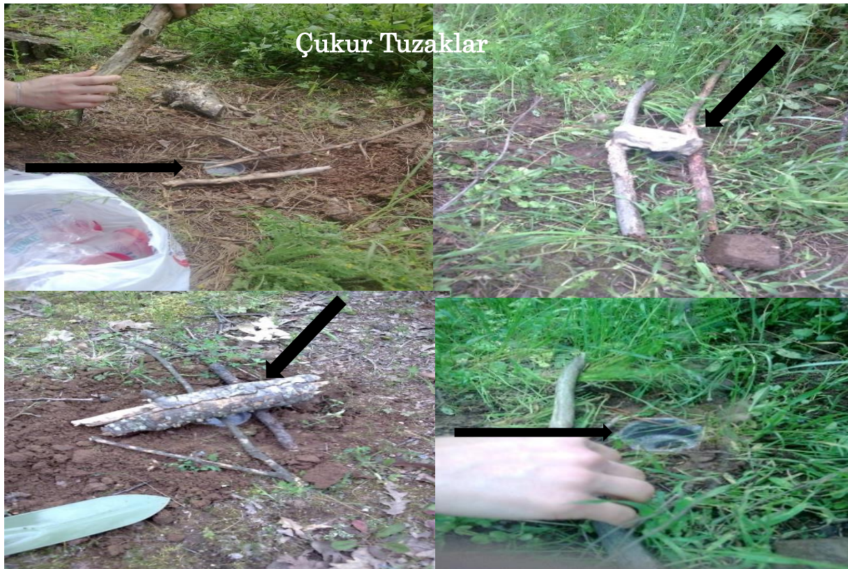
Şekil 2. Çalışma Alanlarında Kurulan Çukur Tuzaklar Figure 2 Pitfall Traps Established in the Study Areas.