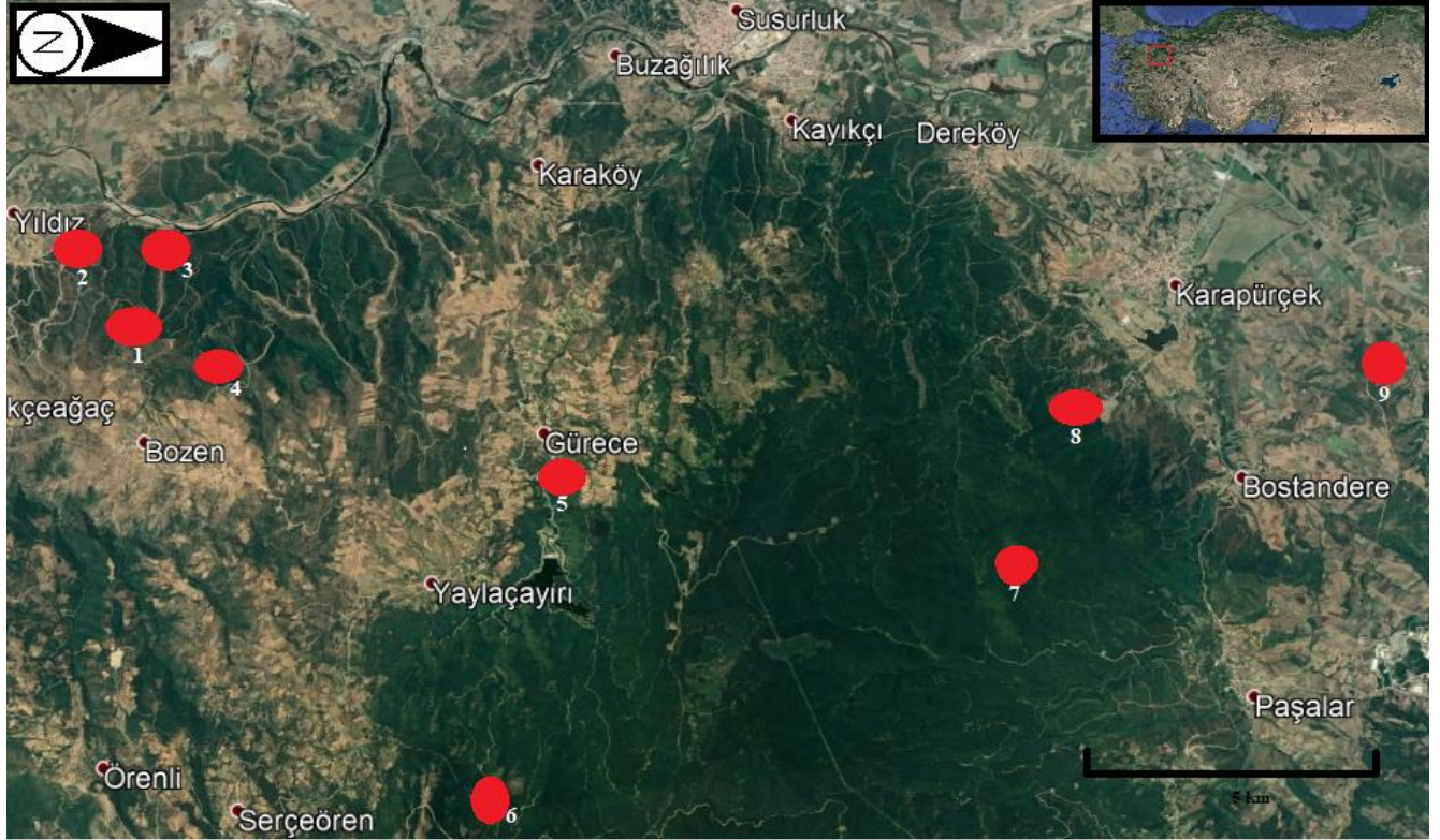
Şekil 1. Çalışma Alanlarının Genel Görünümü Figure 1 The Map of the study fields

tehdit altında olmayan geniş yayımlı türler için Düşük riskli (LC) kategorileri kullanılmaktadır.