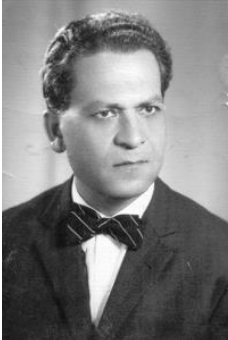
Ek 5: Baymirza Hayit