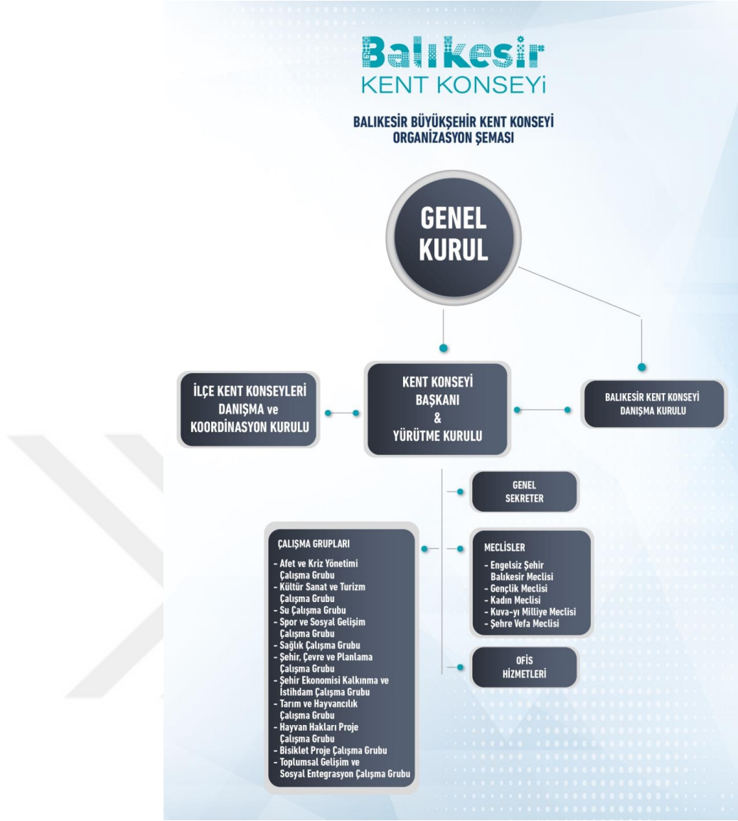
Şekil 2. Balıkesir Kent Konseyi Organizasyon Şeması