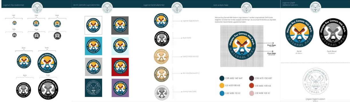
Görsel 6: Kuş cenneti milli parkı için oluşturulan kurumsal kimlik kılavuzundaki logo tasarımının temel tasarım ilkeleri bağlamında oluşturulan dönüşüm süreci.