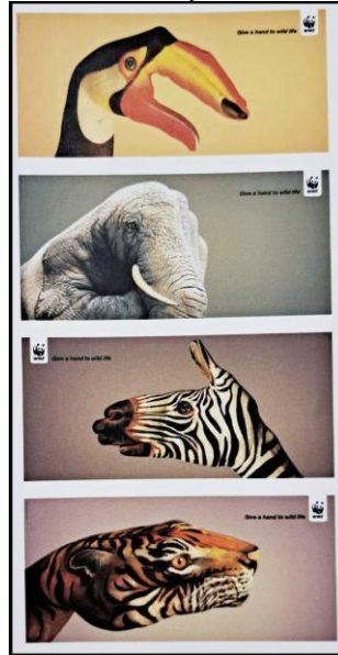
Görsel 19: Give a Hand Wildlife Afiş Tasarımları, Guido Daniele, 2008.