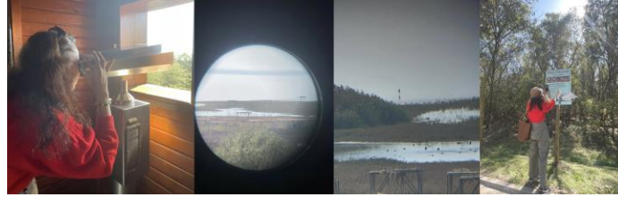
Görsel 2: Kuş cenneti milli parkında yer alan gözlem kulesi, yürüyüş yolu, 2023