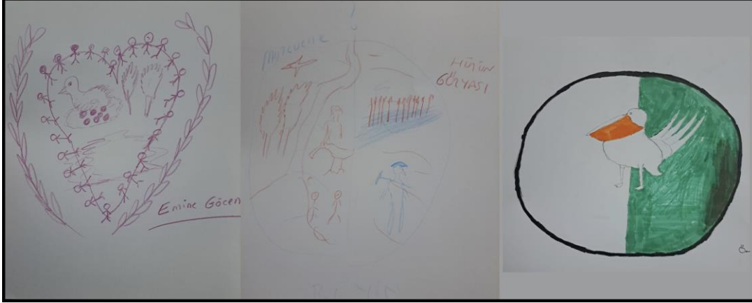
Görsel 24: Kuş Cenneti köyü halkının yaptığı logo tasarımları.