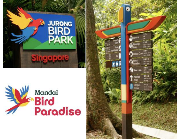
Görsel 3: Mandai bird paradise kurumsal kimlik tasarımı ve bilgilendirme grafikleri.

Kaynak: (Meinblogland.blogspot.com, 23.07.2016) (Wikipedia.org, 03.02.2024)