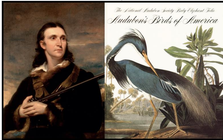
Görsel 18: James Audubon, The Birds of America .