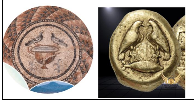
Görsel 9: Antandros antik kenti rölyefi ve kyzikos antik kenti para örneği