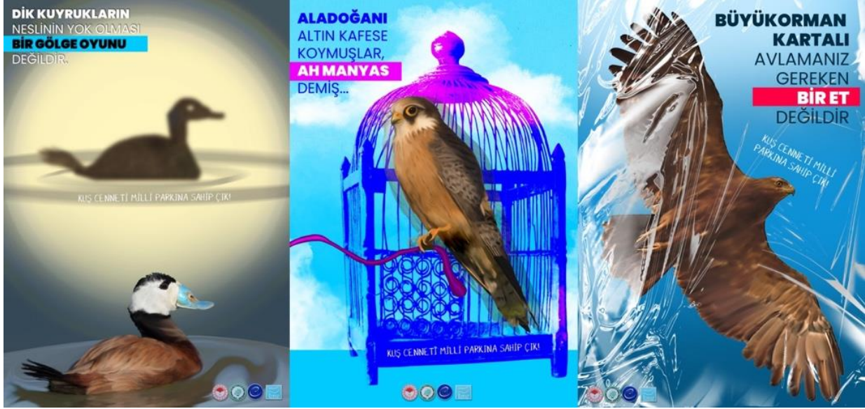
Görsel 21: Görsel propaganda ağırlıklı afiş tasarımı örnekleri, 2024