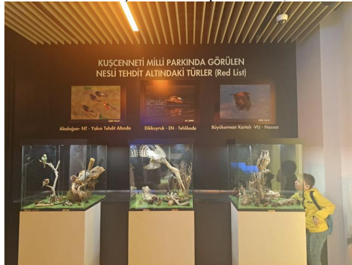
Görsel 20: Kuş cenneti milli parkı müzesi, 2024.