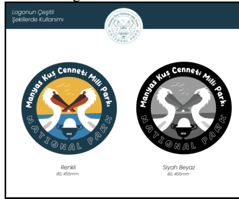
Görsel 5: Kuş cenneti milli parkı için kurumsal kimlik tasarımının en küçük parçalarından biri olan logo tasarımı önerisi.