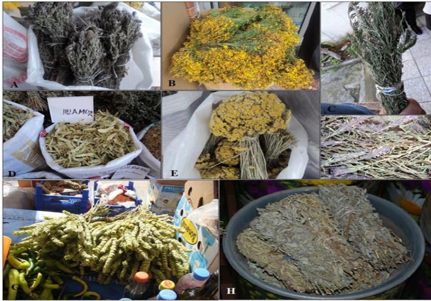
Şekil 2. Balıkesir Dağlarından toplanan ve aktarlarda satılan tıbbi bitkiler. A) Lavandula stoechas subsp. stoechas , B) Hypericum perforatum , C) Rosmarinus officinalis , D) Tilia rubra subsp. caucasica , E) Achillea nobilis subsp. sipylea , F) Thymbra spicata subsp. spicata , G) Sideritis congesta , F) Salvia tomentosa

Yapılan araştırma sonucunda tıbbi bitkilerin çoğunlukla toprak üstü kısımları kullanılmaktadır (%31.25). Bunu yaprakları (%25), çiçekleri (%18.8), meyveleri (%6.3) ve tohumları (%6.3) takip etmektedir (Şekil 3). Tıbbi bitkilerin kullanım şekilleri çoğunlukla infüzyon ve dekoksasyon yöntemi ile olmaktadır. Yaprak ve çiçek gibi hassas organlarda genellikle infüzyon yöntemi uygulanırken; meyve, tohum ve kök gibi dayanıklı kısımlarda dekoksasyon yönteminin uygulandığı tespit edilmiştir (Tablo 1).