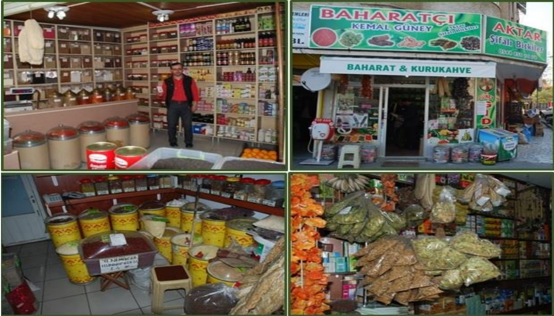
Şekil 1. Balıkesir ilindeki bazı aktarlardan genel görünüm