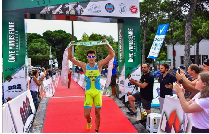
Şekil 2.11. Triatlon koşu etabı bitiş çizgisi.

Triatletlerin gövdelerinin çıplak olması, koşu süresince üstünlük sağlamak amacıyla birbirlerine temas etmeleri yasak olmakta ve teknik görevlilerce kendisi ve diğer yarışmacıları riske atan sporcular da diskalifiye edilmektedir. Bitiş hattına beraber giren ve aynı dereceye sahip olan triatletlerden yaşı daha küçük olanlar öne alınarak sıralanmaktadır. Yarışmacı dışındaki kişilerin ise onların yanında koşması kesinlikle yasaktır.