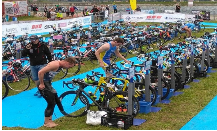
Şekil 2.8. Triatlon deęişim alanı.

Parkur etabını sona erdiren sporcular, deęişme yerine gelerek kask, ayakkabı ilgili malzemeyi giyerek bisikletlerini alırlar ve alanlarından çıkarlar ve bu bölgeden çıkana dek bisikletlerine binemezler. Bu alana sporcular ve görevlilerden başkaları girememektedir. Sporcuların dięer yarışanları engellemesi, gerekli malzemeleri kullanmamaları ve bisikletleri olmadan ilerlemeleri de kurallara aykırıdır (Şekil 2.8.).