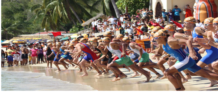
Şekil 2.2. Triatlon yüzme etabı.

seçilen yerlerde hazırlanmış olan geniş parkurlarda yapılmakta ve yarışmacıların suyu rahat bir şekilde terk edebilmeleri için çıkış noktası geniş tutulmaktadır. Avrupa’da yalnızca triatlona yönelik olarak tasarlanmış havuz ve tesisler bulunmaktadır (Şekil 2.2.).