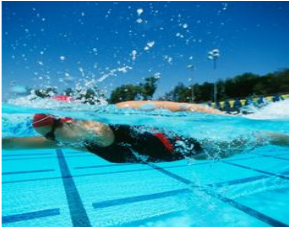
Şekil 2.4. Dolphin kick yüzme stili.

oluşundan dolayı yarış sürecinde avantajlı duruma gelecektir (Şekil 2.3.). Genel olarak yarışmacılar “yunus tekmesi/dolphin kick” yöntemini kullanarak dalgalara karşı kafa üstü dalış gerçekleştirirler. Etabın sonunda ise hızı artırımında dalga enerjisini kullanma suretiyle bedenlerini dalgaların üzerinde kıyıya doğru kaydırmaktadırlar. Yüzme alanı şamandıralarla sınırlandırıldığından sporcular bu işaretleri izlerler. Dolayısıyla yüzme esnasında başlarını su üzerine çıkarmaları gerekmektedir. Değişiklik yapılmış vuruş teknikleri, sporcuların enerji kaybı olmaksızın, başlarını su üzerine çıkararak şamandırayı görmesini sağlar (Beğen, 2008).