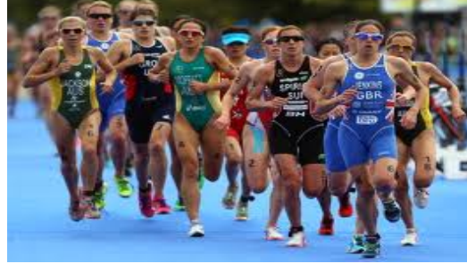
Şekil 2.10. Triatlon koşu etabı.

Koşu etabında yarışın yapılacağı parkur, önceden tespit edilen cadde ve patikalarda olabilmektedir (Şekil 2.10.). Bisiklet etabını tamamlamış olan yarışmacılar, bisikletlerini değişim bölgesindeki yerlerine koymak zorundadırlar. Bu bölgede koşu ayakkabılarını aldıktan sonra koşu parkurunu tamamlamak amacıyla değişim alanını hemen terk ederler. Bu alanda geçen sürenin toplam yarış süresine dâhil olduğunu da belirtmek gerekir. Sporcular, numaralarını da koşu esnasında önden görülebilecek biçimde takmalıdırlar. Triatletlere hiçbir dış destek verilmemekle birlikte resmi serinleme istasyonlarında su ve yiyecek takviyesi yapılabilmektedir.