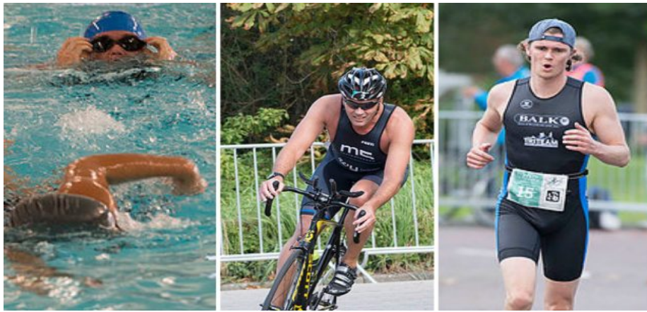
Şekil 2.1. Triatlon sporu.

Spor, birtakım fiziksel etkinlikler bütünü olarak değerlendirilmesinin yanında, kişilere bireysel ve sosyal kimlik ile grup aidiyeti duygusu vermesiyle kişinin sosyallik kazanmasına katkıda bulunan bir olgu olarak da ele alınmaktadır (Küçük ve Koç, 2004). Ayrıca kişiler yönünden bir dürtü, kendini anlatma şekli, başarı ölçme unsuru, toplumsal yönden de eğitime, toplum dokusuna ve sosyo-ekonomik yapıyla uyumlu bireyleri yönlendirme aracı olarak da ifade edilebilir (Dever, 2010). Spor, aynı zamanda tek başına veya kolektif olarak yapılan ve belirli kurallara sahip, özel teknik gerektiren, gerek fiziksel gerekse de düşünsel etkinlikleri kapsayan bir olgudur (Koç, 2005). Sporun en önemli işlevlerinden birisi de saldırganlık güdüsü için barışçı ve arındırıcı bir boşalma olanağı sağlamaktadır. Spor aracılığıyla saldırganlık ve şiddet eylemleri gibi toplumu tehdit edici ve tehlikeli durumlar da engellenebilir (Balçioğlu, 2003). Spor etkinlikleri sürecinde kişilerin sürekli interaktif iletişimi, bireysel ve sosyal uyum yönünden adeta bir laboratuvar çalışması şeklinde de değerlendirilebilir. Triatlon sporu ise yüzme, koşu, bisiklet branşlarının art arda yapılmasından oluşan multidisipliner, olimpik bir spor branşdır (Şekil 2.1.).