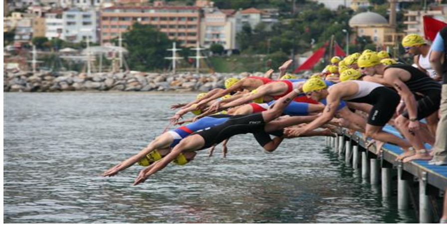
Şekil 2.3. Triatlon yüzme etabı (Alanya Belediyesi, 15 Ekim 2018).

Sporcular, yüzme etabında bacaklarını yüzücülere oranla daha dikkatli ve az kullanmaktadırlar. Zira gerek koşu, gerekse bisiklet etaplarında bacak kasları enerjisini korumaları gerekir. Çok sayıda yarışmacı, türbülansı dengeleme ve uzun süreli yüzmeye sağlama amacıyla farklı stiller geliştirmektedir (Mora, 1999). Bu etapta triatletler, avantajlı bir pozisyona sahip olmak durumundadırlar. Zira sporcu, diğer triatletin akıntı boşluğundan faydalanarak ilerlediğinde enerji kaybının az