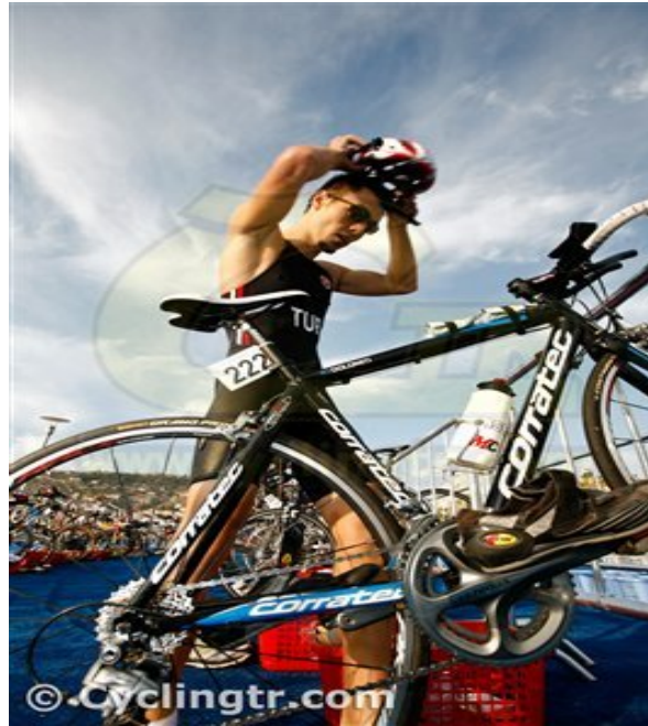
Şekil 2.9. Triatlon bisiklet etabı deęişim alanı.

Parkur etabını sona erdiren sporcular, deęişme yerine gelerek kask, ayakkabı ilgili malzemeyi giyerek bisikletlerini alırlar ve alanlarından çıkarlar ve bu bölgeden çıkana dek bisikletlerine binemezler. Bu alana sporcular ve görevlilerden başkaları girememektedir. Sporcuların dięer yarışanları engellemesi, gerekli malzemeleri kullanmamaları ve bisikletleri olmadan ilerlemeleri de kurallara aykırıdır (Şekil 2.8.).