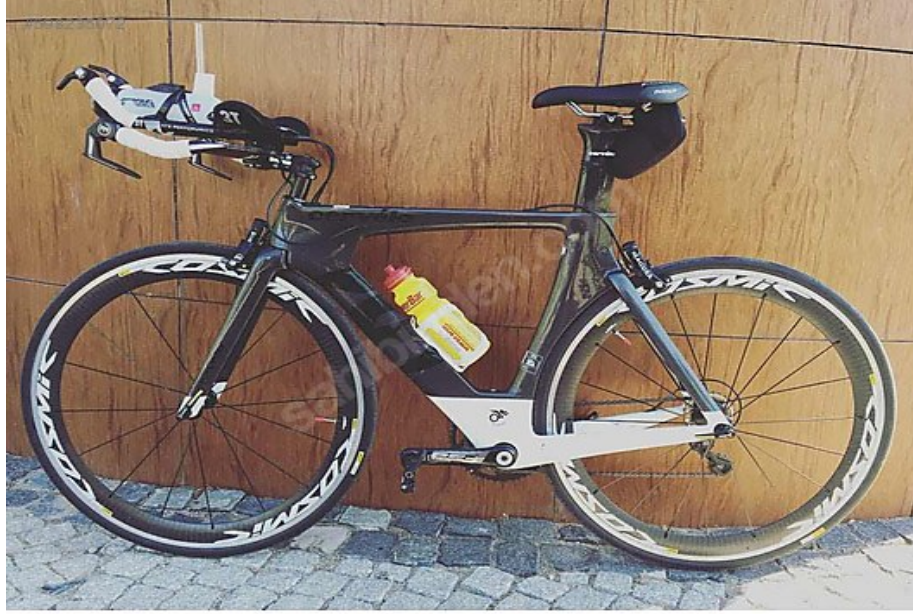
Şekil 2.7. Triatlon bisikleti.

koşudan önce birikmiş olan oksijen borcundan sporcuu koruduğu ifade edilmektedir (Ricard ve ark., 2006).