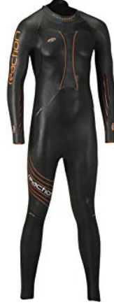
Şekil 2.5. Triatlon wetsuit.

Sporcular, yüzme etabında dinlenmek için kendilerine avantaj sağlamak amacıyla durmak ve tutunabilme hareketlerini kullanmamalıdır. Herhangi bir acil durumda ise görevlilerin yardımını talep eden yarışmacı ise yarışmadan ayrılmaktadır.