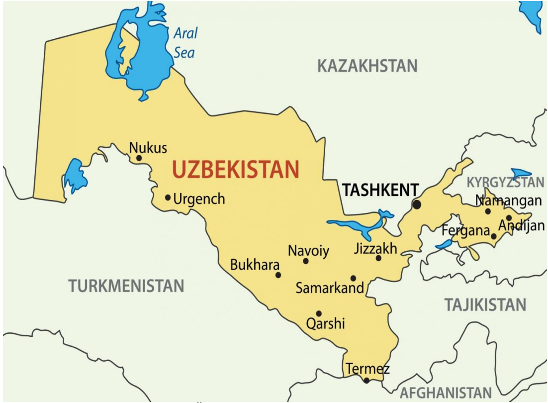
Harita 5. Özbekistan Cumhuriyeti Haritası

ihtiyaçlarının karşılanmasına büyük katkıda bulunması beklenmiştir. 1996'da Taşkent büyük makro-ekonomik mali dengeleri kurmayı başarmıştır (Kanlı, 2009).