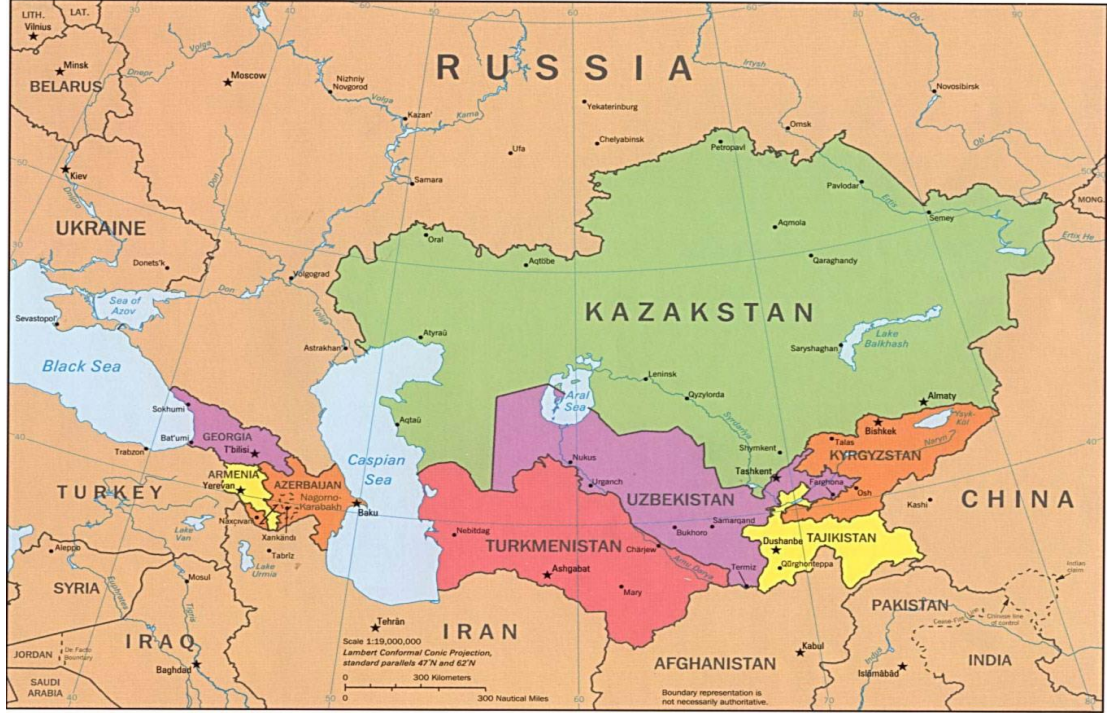
Harita 2. Kafkasya ve Orta Asya Haritası

Geçmişte de günümüzde de üzerinde yaşanan toprakların değeri, sadece o topraklarda yaşayanların değil, yaşamak isteyenlerin ve faydalanmak isteyenlerin de dikkatini çekmiştir. Tarih boyunca yapılan savaşların birçoğunun sebebi ülkelerin yeraltı ve yerüstü zenginlikleridir. Nitekim Türkistan da tarih boyunca birçok işgale uğramış, esaret altında yaşamıştır. Bugün hala esaret altında yaşayan, bağımsızlığını kazanamamış Türk yurtları mevcuttur. Bu durumun sebebi öncelikli olarak Türkistan topraklarının değerli olmasıdır.