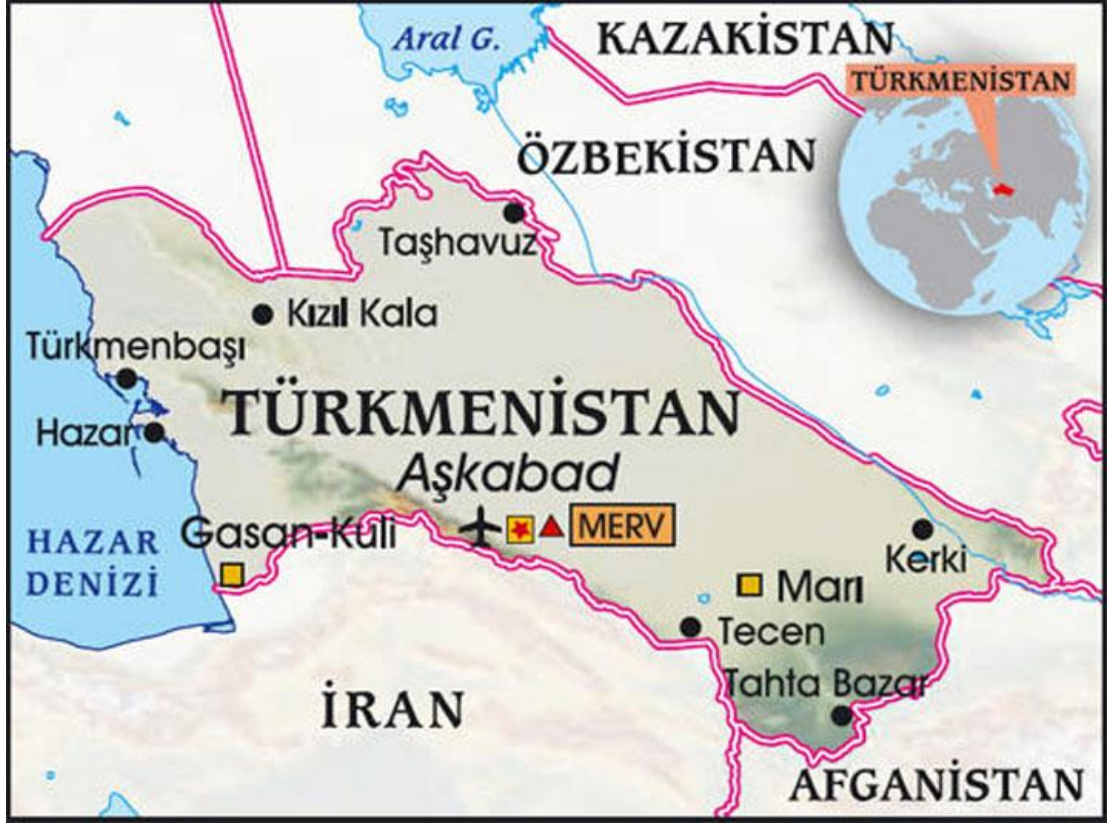
Harita 7. Türkmenistan Cumhuriyeti Haritası

Türkmenistan, demokratik ve laik bir cumhuriyettir. Parlamenteoya dayalı başkanlık sistemi ile yönetilmektedir. Eğitimden sanata, teknolojiye bilim, ekonomiye ulaşan bütün alanlarda çağın gereklerini yerine getirerek kalkınma çabası içindedir. Dış ilişkilerini geliştirerek dünyadaki önemli sivil toplum örgütlerine üye olarak gelişmiş ülkeler arasında tanınmaya ve güçlenmeye çalışmaktadır (Günay, 2010).