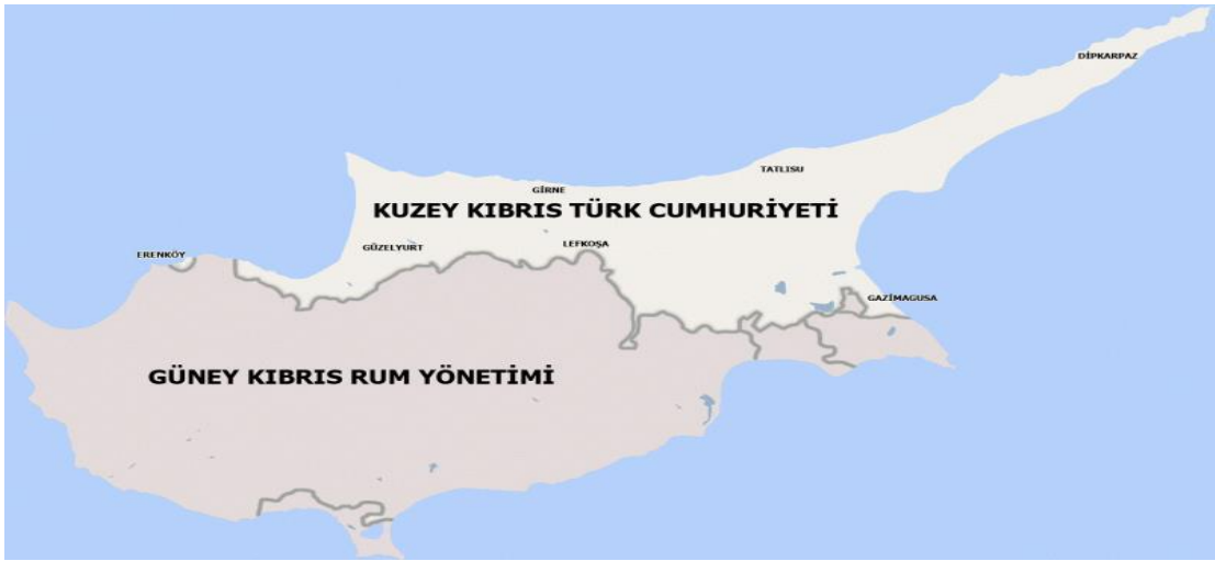
Harita 8. Kıbrıs Haritası

Adanın ismi ilk kitabelerde “İsj” diye yazılmış sonra “Alaşın” şekline dönmüştür. İbrani belgelerinde “Kittim” olarak kaydedilmiştir. Kıbrıs adı ise Sümercedeki “bakır” anlamına gelen “Zubar” kelimesinden türetildiği düşünülmektedir “Kypros” şeklinde ise ilk kez Homeros’ta görülmektedir. Kıbrıs Akdeniz adaları içerisinde yüzölçümü bakımından 3. sırada yer almaktadır. Toplam yüzölçümü 9.250 km 2 ’dir. Türkiye’ye Anamur’dan 71 km, Suriye’ye 100 km, Mısır’a 400 km, Yunanistan’a ise 800 km mesafededir. Ada’da 215 bin kuzeyde,562 bin ise güneyde olmak üzere toplam 677 bin Türk ve Rum nüfus yaşamaktadır (Bayram, 2011).