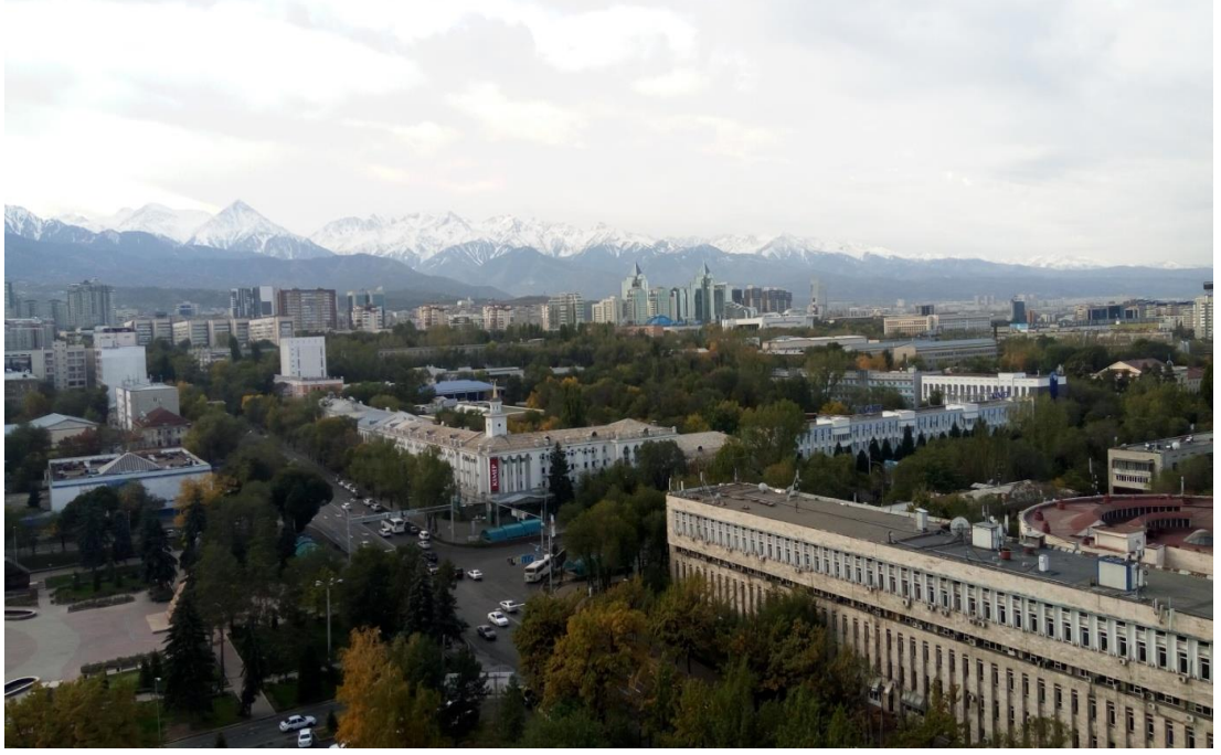
Fotoğraf 2. Kazakistan'ın eski Başkenti Almatı'dan bir görünüm. Ufukta Tanrı Dağları, halk arasındaki ismiyle; "Han Tengri" (12.10.2016'da tarafımdan çekilmiştir.)