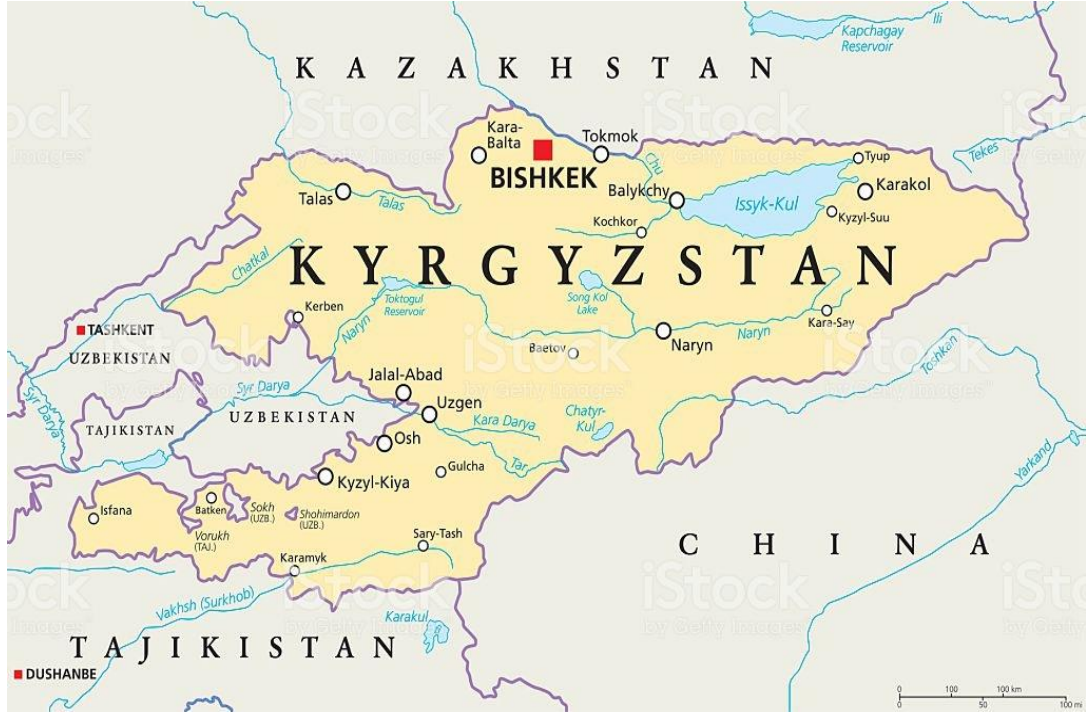
Harita 6. Kırgızistan Cumhuriyeti Haritası

Kırgızistan'ı ilk tanıyan devlet Türkiye Cumhuriyeti'dir. Gerek kültürel, gerek ekonomik anlamda iki ülke arasında ilişkiler mevcuttur. Bunun en büyük örneği Bişkek'teki Türk-Manas Üniversitesi'dir.