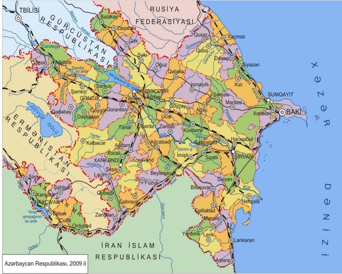
Harita 3. Azerbaycan Cumhuriyeti Haritası

Azerbaycan'da gelişmiş bir kültür hayatı vardır. Özellikle edebiyat, tiyatro ve müzik alanlarında gelişmiş bir Azeri kültürü ile karşılaşırız. Bu kültür zenginliği sadece Sovyet politikasından kaynaklanmamaktadır. Azerbaycan'ın tarihinden de kaynaklanıyor. Mesela Azeri Türkçesi 14. yüzyıldan beri Edebiyat dili olarak kullanılmakta olup Fuzuli ve Nizami gibi çok seçkin temsilcilere sahiptir (Demir, 1998).